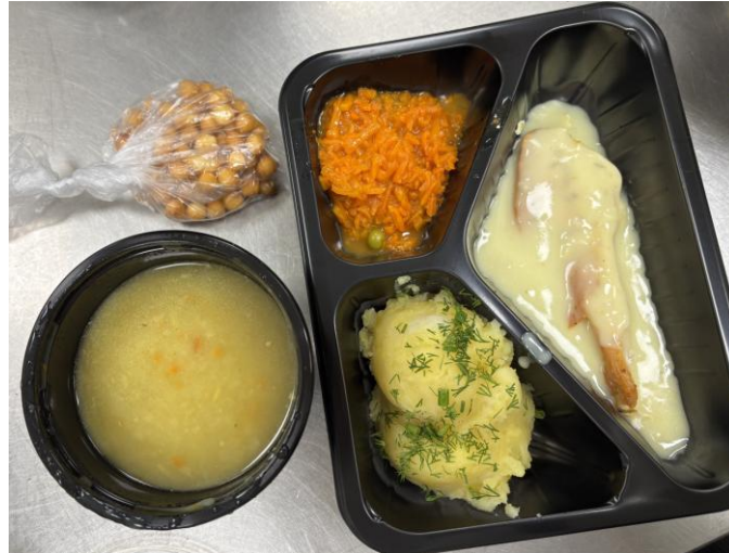
1. Obiad w diecie łatwostrawnej.