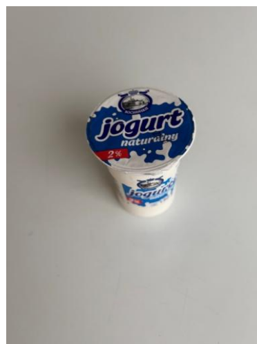
3. II kolacja w diecie z ograniczeniem łatwo przyswajalnych węglowodanów.