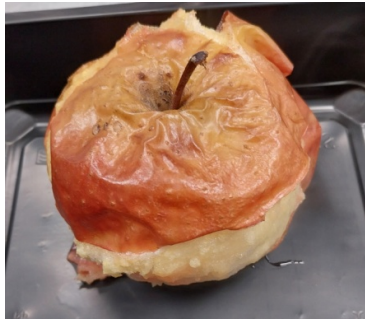
Zdjęcie 3. II Kolacja w dietach.