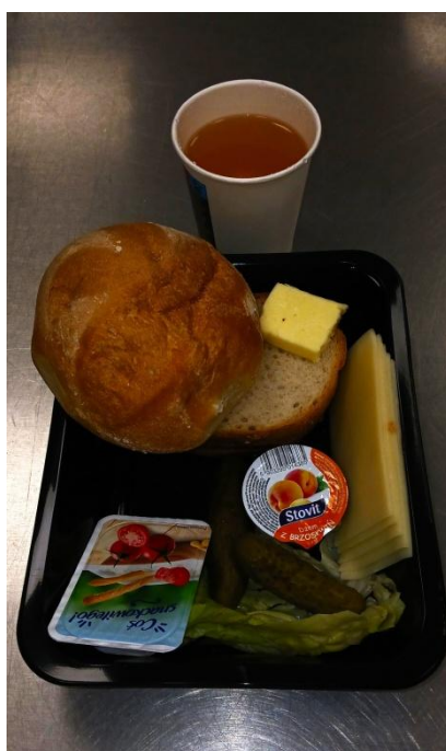
Zdjęcie 2. Śniadanie w diecie podstawowej